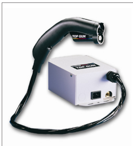
Obr. 5. Ionizační pistole s napájecím zdrojem