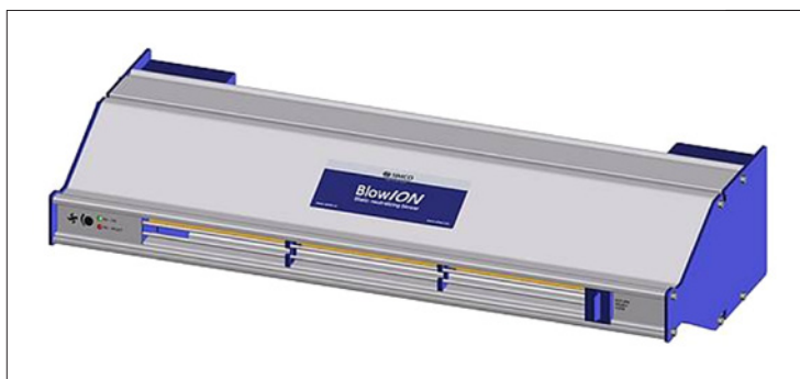
Obr. 4. Ionizační ventilátor

vlhkost vzduchu vyvolat jiné výrobní problémy (vznik koroze, problémy při pájení atd.).