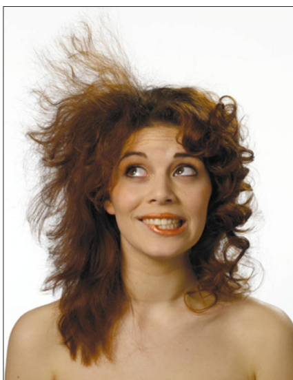
Obr. 1. Statická elektřina je všudypřítomná

Jestliže se elektrostatické výboje objeví v prostředí s přítomností rozpouštědel nebo různých prachů, jde opravdu o nebezpečnou kombinaci s možnými fatálními následky.