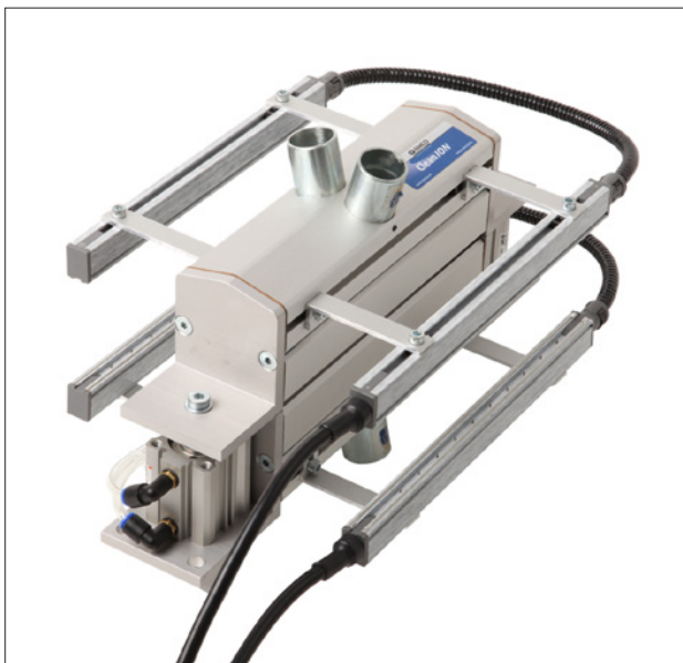
Obr. 6. Hlavice zařízení pro odsávání nečistot s ionizačními tyčemi

Zařízení pracující na základě indukce nejsou externě napájená, ale využívají stejný