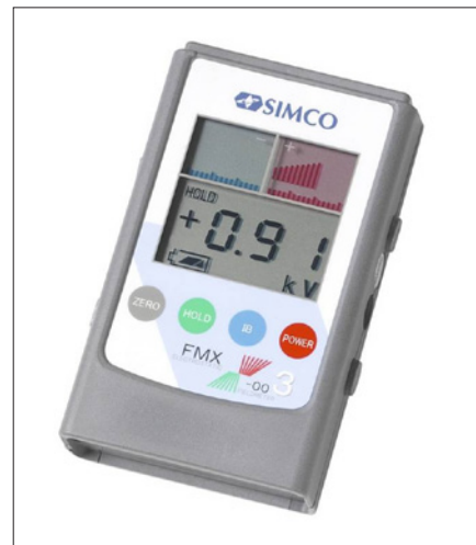
Obr. 7. Přístroj k měření intenzity elektrostatického pole

2. Ionizační vzduchové ventilátory opět obsahují emitační hroty, přes které ventilátor fouká vzduch na požadované místo. Jsou k dispozici přenosné modely pro umístění na pracovních stolech nebo modely určené pro stabilní umístění. Tyto jednotky jsou schopny neutralizovat materiály až do vzdálenosti 1,5 m a jsou zvláště vhodné pro součásti a materiály s nerovným povrchem (3D rozměrem), ale také pro pásy a fólie při navíjení (obr. 4).