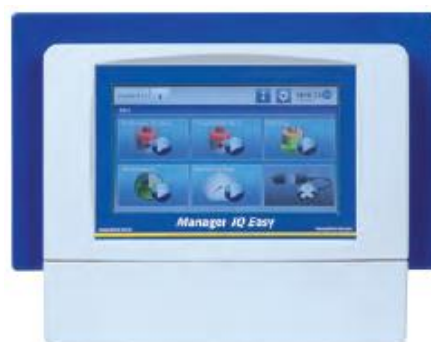
Barevná dotyková obrazovka s úhlopříčkou 7“