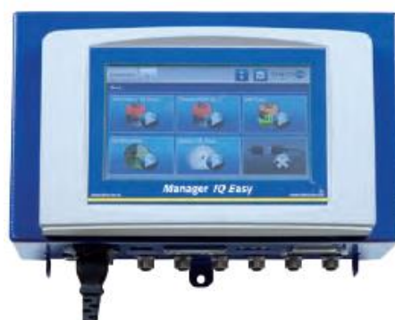
Snadný přístup ke kabelům