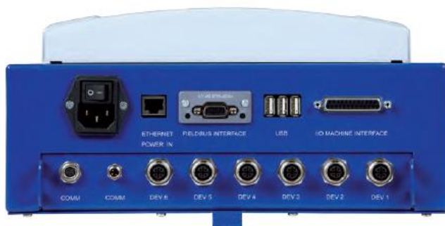
Připojení až šesti zařízení